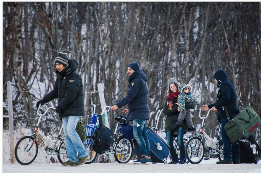
TIL STORSKOG: Flyktninger ankommer Storskog på sykkel. Ruten gjennom Russland til Norge ble mye brukt i høst, men nå har grensepasseringene ved Storskog stoppet opp.

UDI-direktør: – Aner ikke hvor mange som kommer