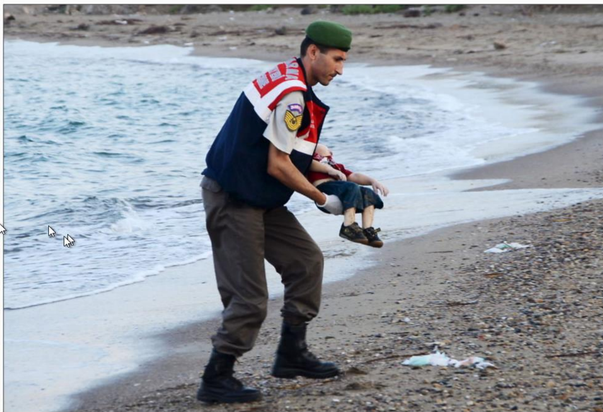
DRUKNET PÅ FLUKT: Her blir den tre år gamle gutten - en syrisk flyktning - båret bort av tyrkisk militærpolitipersonell. Gutten ble funnet ved Bodrum i Tyrkia.