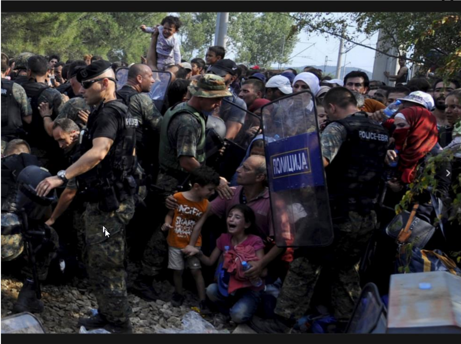
GRATENDE BARN: Barnefamilier, voksne, unge, gamle, syke og svake. Minst tusen flyktninger som har kommet seg gjennom Hellas, stanses på grensen til Makedona. Vitner forteller om mennesker som kollapser, skrik og gråt.