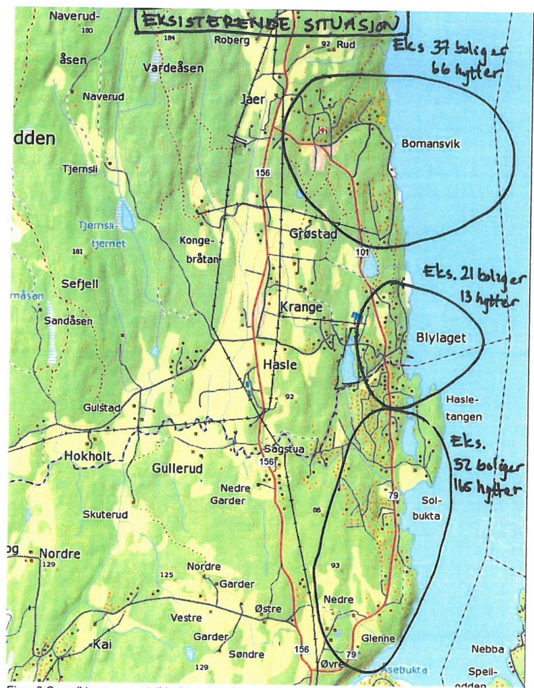
Figur 2 Oversikt over ca-antall boliger og hytter, etter manuell telling på kart.